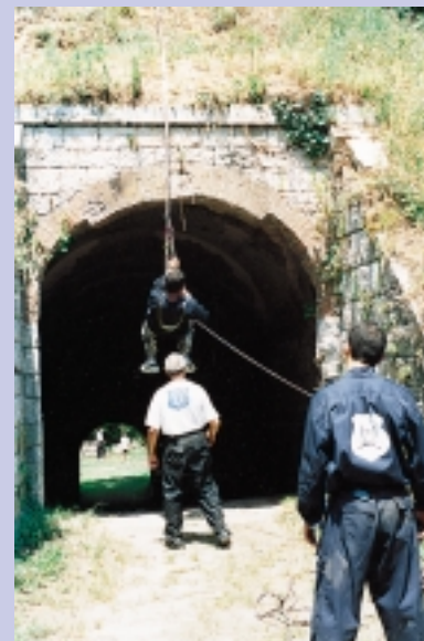
... jumping techniques

La Cnfps è: • iscritta alla Drtefp al numero 93060386106