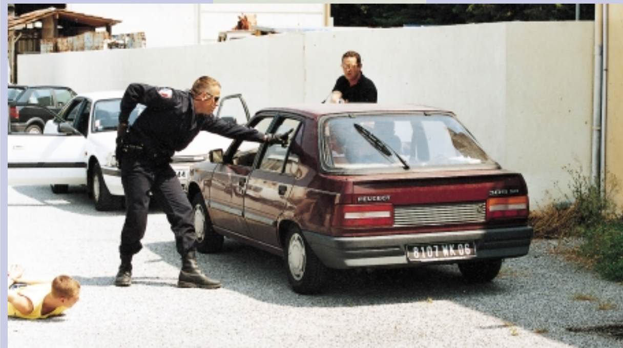
The security guards of CNFPS in training